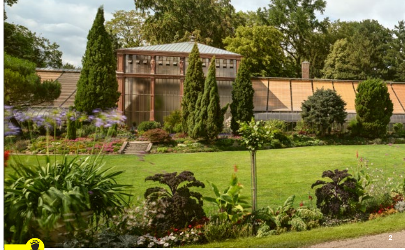
Historische Gebäude und der besondere Pflanzenbestand machen den Reiz des alten Botanischen Gartens aus

In den neu eröffneten Gewächshäusern erwartet die Gäste eine Vielfalt prachtvoller Pflanzen